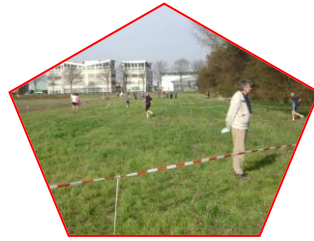
Controle tijdens de cross