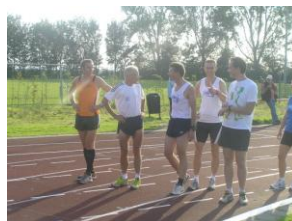
Win jij of win ik?